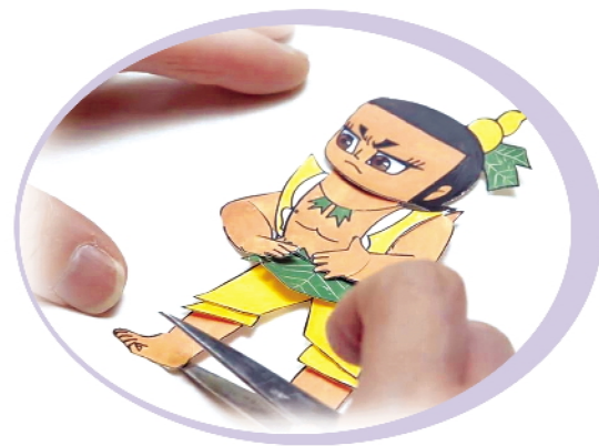
《了不起的匠人》中葫芦娃动作演示

正如我们介绍过的剪纸动画片一样,《葫芦兄弟》也是一部剪纸动画片,全片有2000多个镜头,要让这些镜头很流畅地动起来是不容易的。为了让角色更加鲜活,纸偶在制作时保留了很多可动的关节,动作设计人员需要小心地用小镊子一点点地调整每一个动作,甚至连眼睛也不放过。