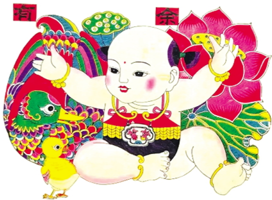
民间年画娃娃作品

《葫芦兄弟》中的场景融合水墨的虚实效果和工笔重彩的肌理感,国风味十足。值得一提的是,《葫芦兄弟》中出现了很多光电效果,当时的这些特效现在看来极具年代感,是时代特有的艺术风格。