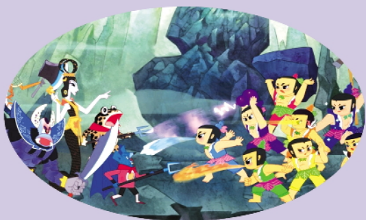
《葫芦兄弟》影片画面

娃属水，六娃会隐身，七娃有个宝葫芦……如果七人合体就更了不得。但即使他们如此强大，也有自己的弱点，面对精明强悍的坏人，他们必须互相帮助，发挥团结的力量。